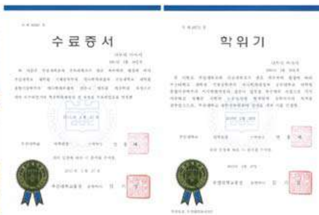
機械工学専攻修了証書と学位記(苗村 将志 君)