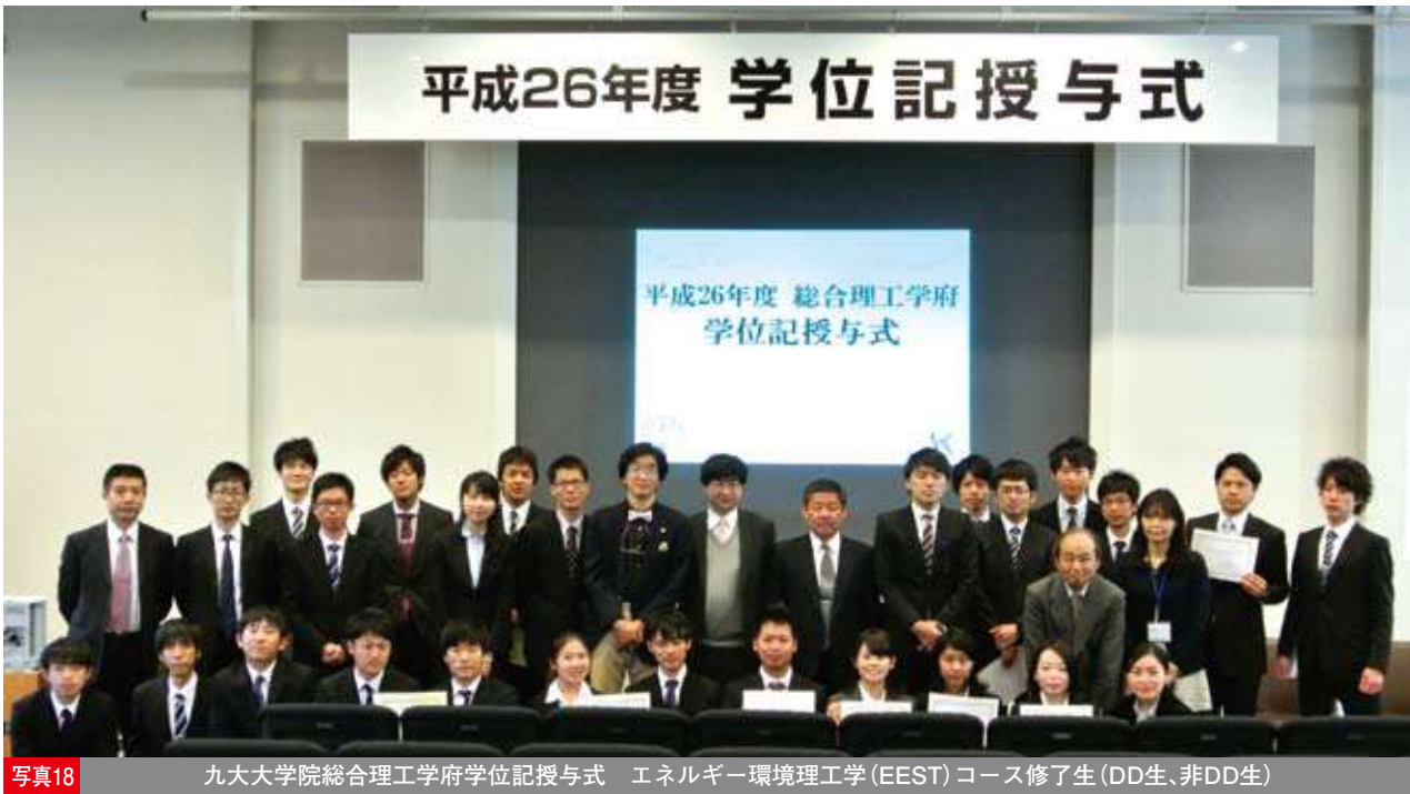
写真18 九大大学院総合理工学府学位記授与式 エネルギー環境工学(EEST)コース修了生(DD生、非DD生)