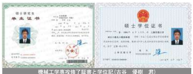
機械工学専攻修了証書と学位記(古谷 優樹 君)