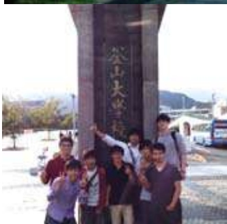
釜山大に入学した九大のDD生達

九州大学キャンパスアジアプログラムの当初目標であった、エネルギー環境理工学部門修士課程においてダブルディグリー (DD) を取得するためのプログラムが完成しました。このプログラムに従えば、修士課程ダブルディグリー (DD) の取得は、半期の留学と、2回のサマースクール、及び出身大学及び留学先大学の両方の大学に共通の英語の修士論文提出により、通常の修士修了に要する年限で可能になっています。とはいえ、サマースクールでは、2週間ずつ2回の講義・演習・実習と濃密なプログラムになっている上、留学時に取得が必要とされる単位も少なくありません。このため、学生にとっては、かなりきびしいものになっていることは想像に難くありませんが、20名の学生が今春めでたくDDの取得に成功し、巣立っていきました。本号では、彼らのDD取得に至るまでの道程を簡単に振り返って見ました。