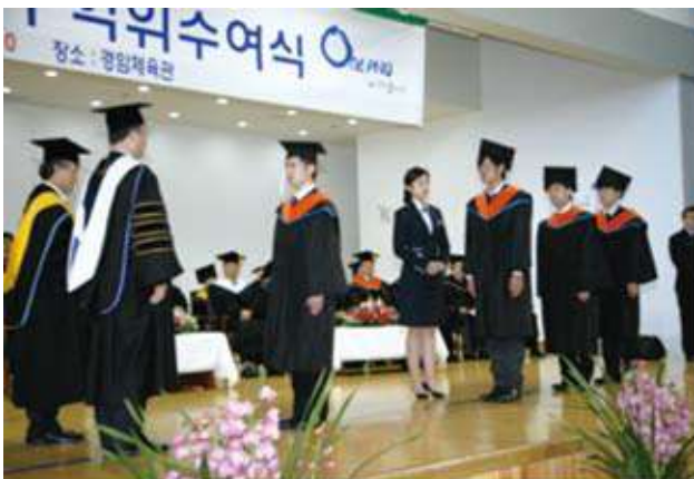
写真16 釜山国立大学校大学院工学府修了式