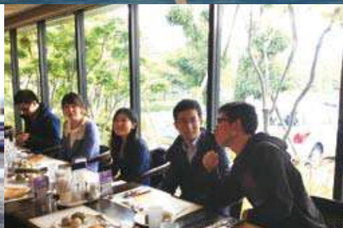
九大に入学した上海交通大のDD生達