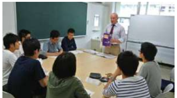
写真3 米国人講師による少人数実践英語教育