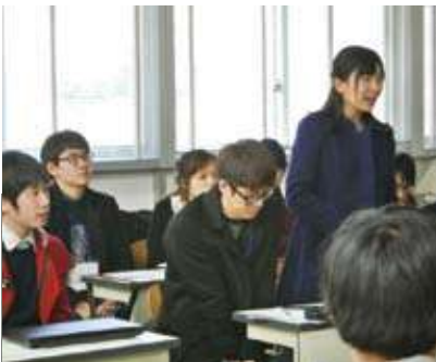
懸命に説得しようとするSJTUの学生