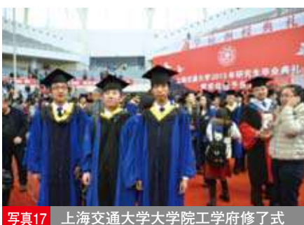
写真17 上海交通大学大学院工学府修了式