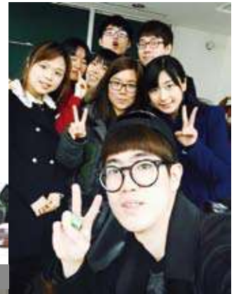
セミナーの終わりを祝して