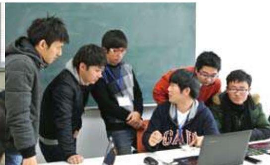
ディベートセッションにて同一グループ内でディベートに備えて準備