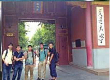
上海交通大に入学した九大のDD生達