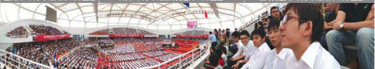
上海交通大学に入学/留学し、そのマンモス入学式に出席した九大のDD生