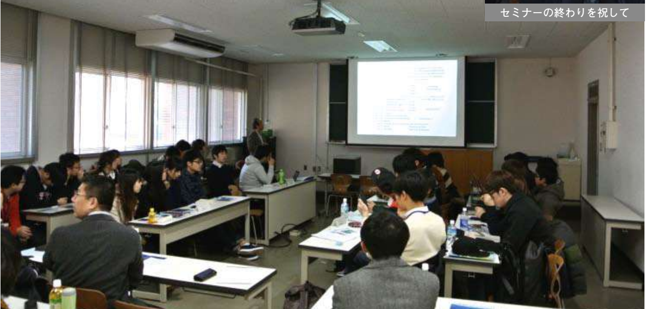
学生によるディスカッションセッションとディベートセッション