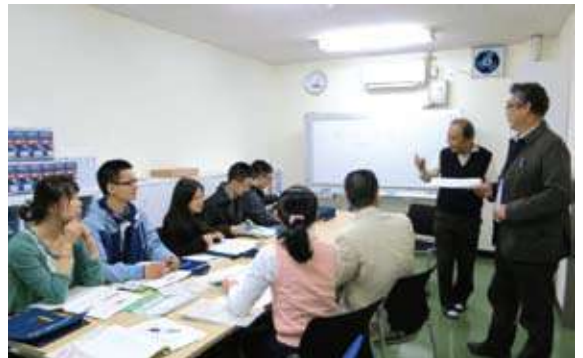
写真1 平成25年4月入学したSJTUからのDD留学生へのオリエンテーション