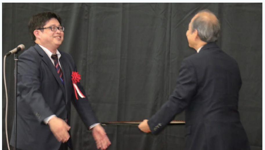
福島 崇 文科省高等教育局企画官(大臣代理 左)による賞状授与