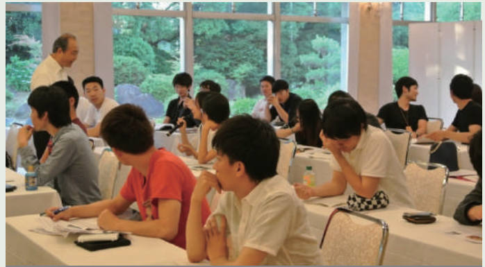
ホテルにてレクチャーと引き続きディスカッションセッションを開催