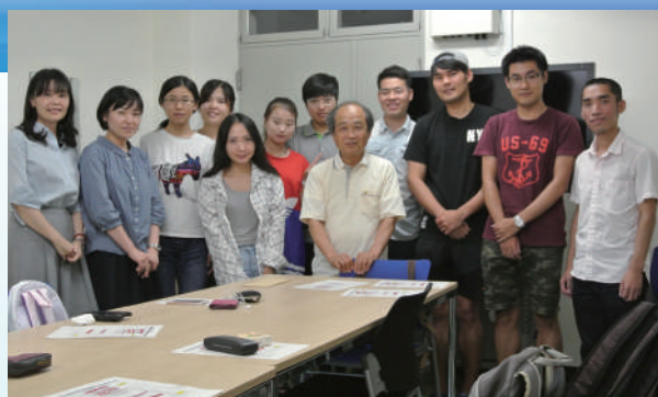
上海交通大学と釜山大学からの新入留学生たちと

文科省の補助金によるCA事業は2015年度で終了していますが、九大、釜山大、上海交通大学は、プログラムの重要性/有用性を高く評価し、独自予算で継続することで合意し、2016年度もDD生の募集を行いました。2016年度、上海交通大学及び釜山大学からのDD入学生はそれぞれ8名と4名で、7名と2名が4月に九大に留学して来ました。九大からは、上海交通大学、釜山大にそれぞれ4名と3名が9月から入学することになっています。写真は4月に九大に入学したDD留学生です。