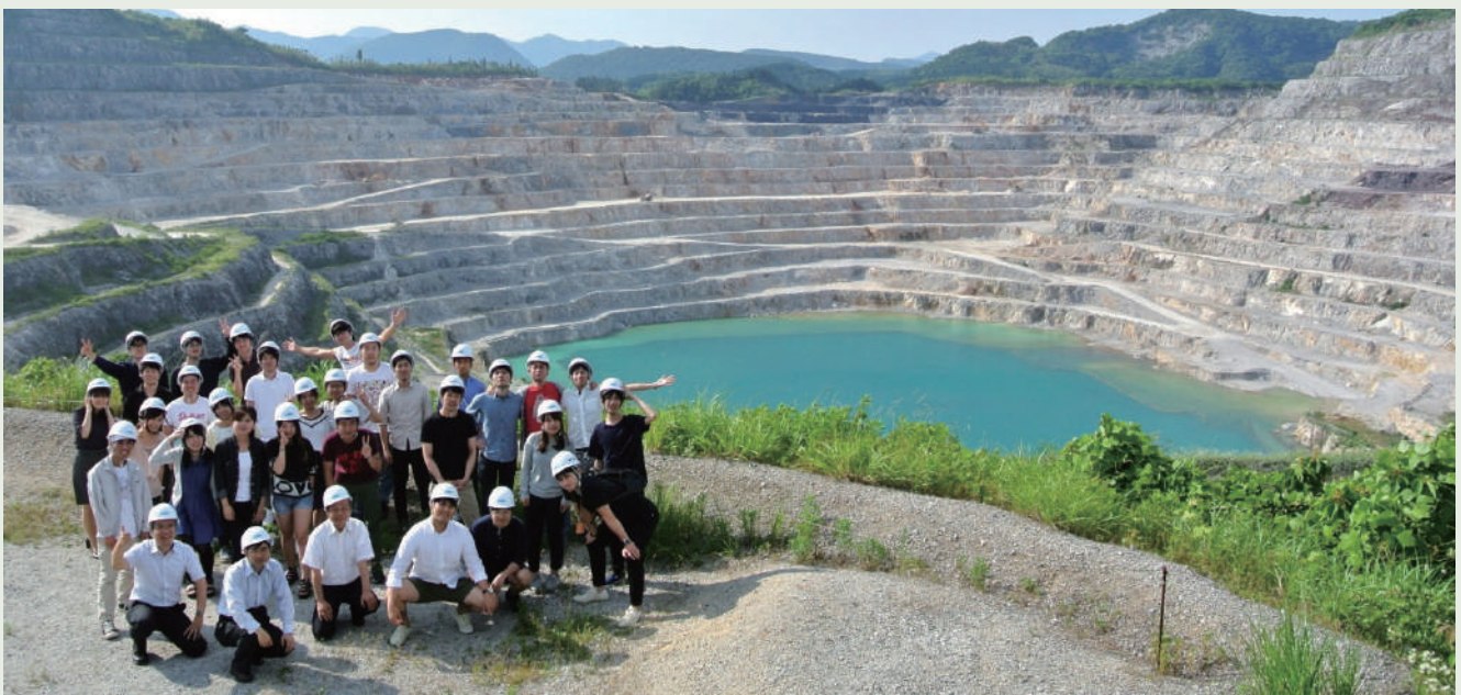
宇部興産 石灰石鉱山