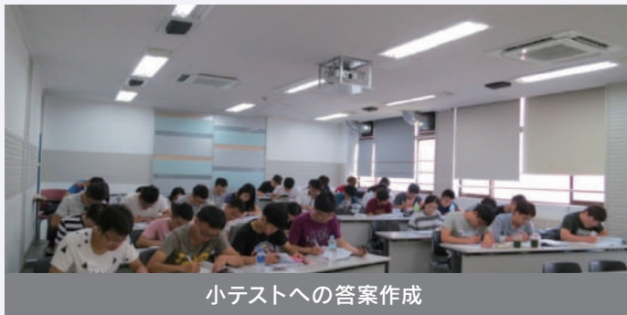
小テストへの答案作成