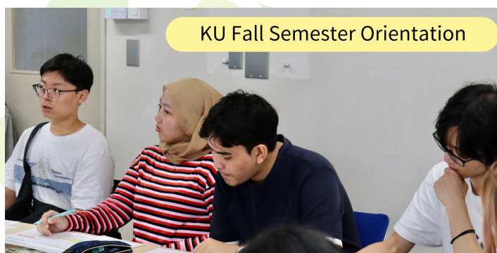
KU Fall Semester Orientation