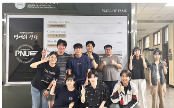
Pusan National University

2024 New DD students departed for their host universities respectively. Meanwhile, inbound DD students came to IGSES, Kyushu University in April and October. At the CAMPUS Asia orientation held for new international students, everyone listened intently to the guidelines.