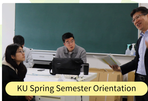
KU Spring Semester Orientation