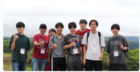
Summer School Participants