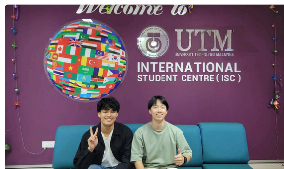
Universiti Teknologi Malaysia