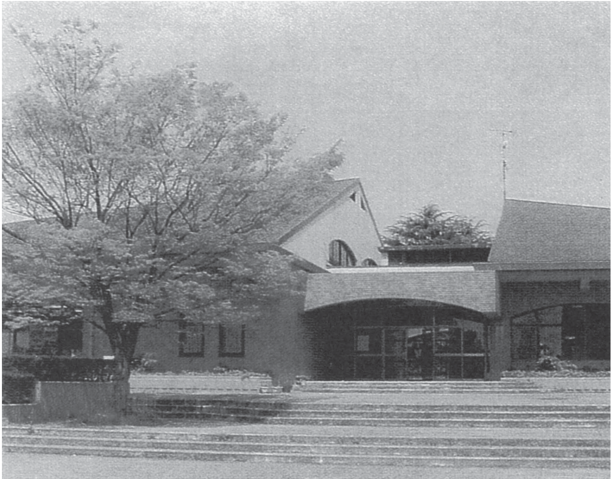
Welfare Facilities (Vista Hall)

The Graduate School was founded on the philosophy of its own. Many policies, procedures and regulations may be confusing and hinder pursuing academic success in this unique campus. This handbook is designed to provide guidelines that can help you better understand the values of Kyushu University and this campus. We hope you find the information contained in this handbook handy during your graduate life.