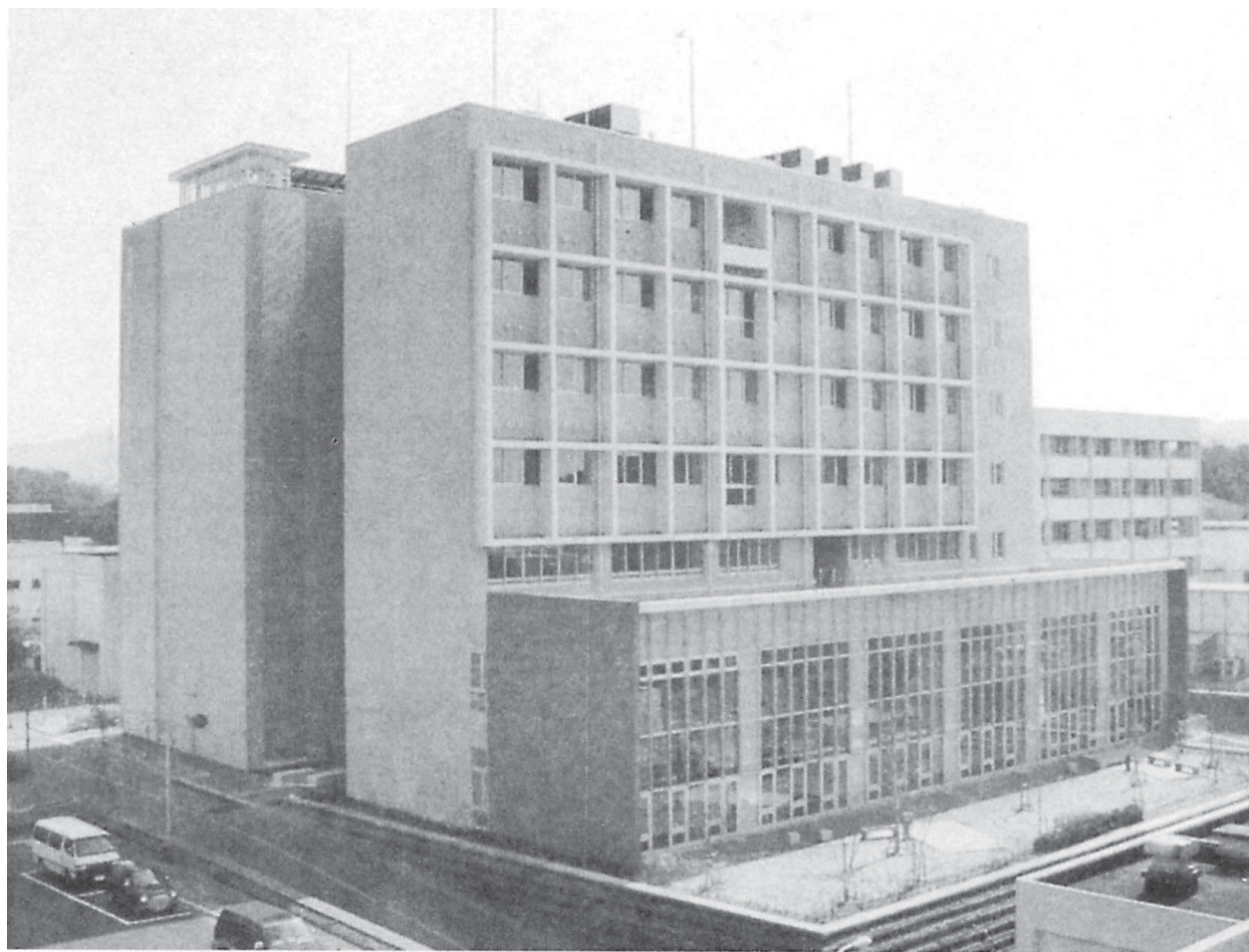
筑紫図書館・総合研究棟